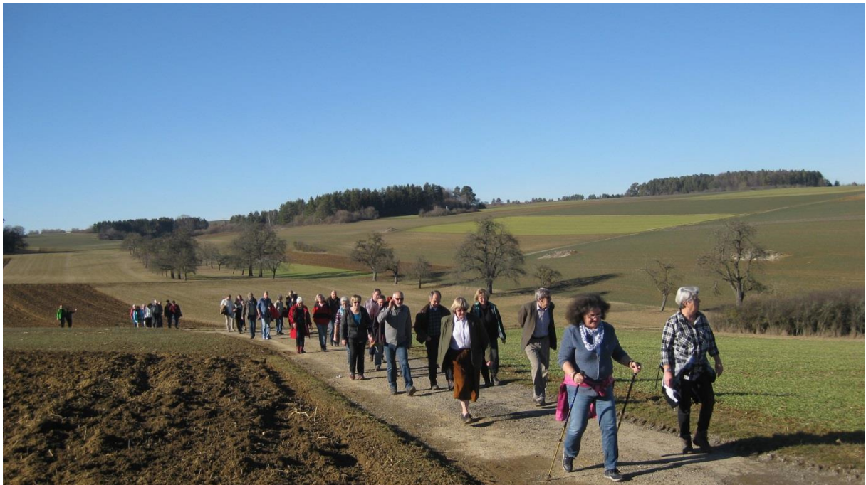
Bild von der Wanderung im Februar 2019